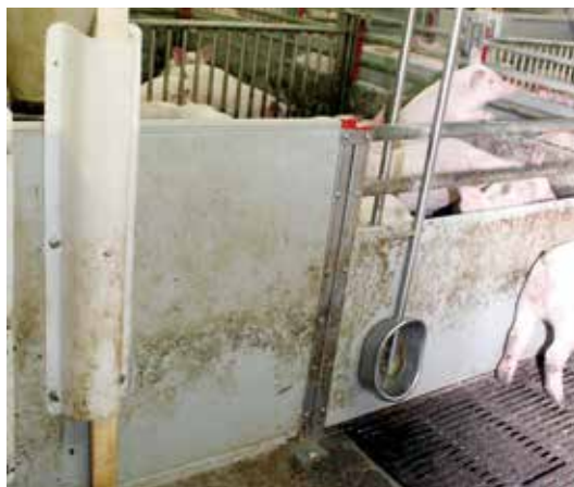
Billede 1: Halm på trådnnet er en enkel løsning til tildeling af beskæftigelses- og rodemateriale til f.eks. søer og gylte.