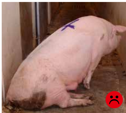
Udskridning Bedømmelse: Ikke transportegnet