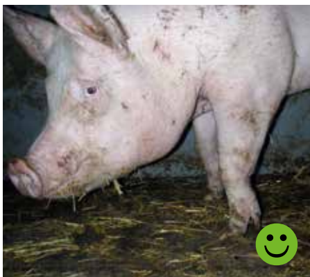
Krumme forben (styltefod) uden ledbetændelse eller andre komplikationer Bedømmelse: Transportegnet